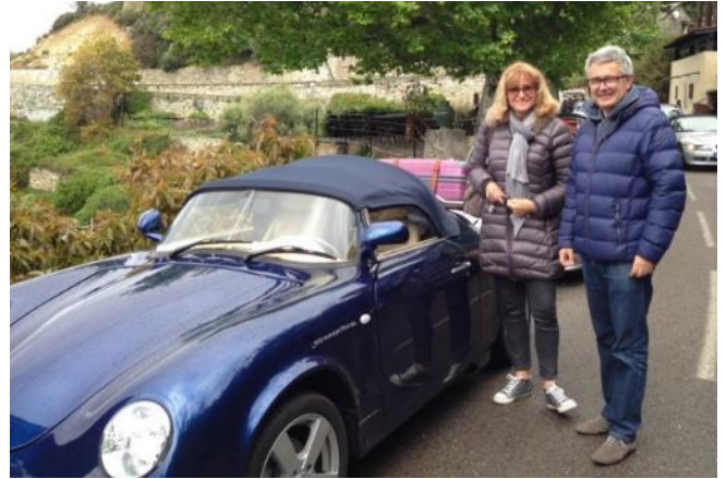
PGO Speedster 2 de 2005